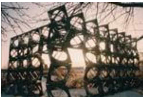
Del av helhet – helhet del av I

Skulptören Bertil Herlov Svensson är också representerad med skulpturerna Del av helhet – helhet av del I och Del av Helhet – helhet av del II som man hittar på Båthöjden respektive Fiskarhöjden. Material Aluminium.