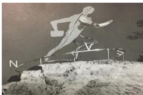
Orienteraren – konstnär Olle Carlström

Titta upp på den lilla bergsknallen mellan motorvägen och Saltsjöbadens Centrum, i folkmun Tippen. Där glänser Orienteraren . Ett monument över världens första orienteringslopp, uppfördt i rostfritt stål av konstnären Olle Carlström med invigning 1975. Världens första officiella orienteringslopp utlystes 1919 av löjtnant Ernst Killander och gick mellan Saltsjöbaden och Nackanäs. Tävligen blev upptakten till hela orienteringsidrotten.